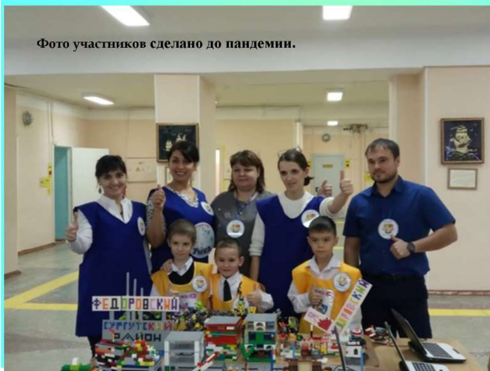
Фото участников сделано до пандемии.

Также были выбраны 5 победителей в дополнительных номинациях: «За внедрение передового опыта и инновационных технологий в области охраны труда», «За многолетнюю работу без производственного травматизма», «За активное участие в пропаганде вопросов охраны труда», «За лучшую творческую инициативу в области охраны труда», «За стремление к победе».