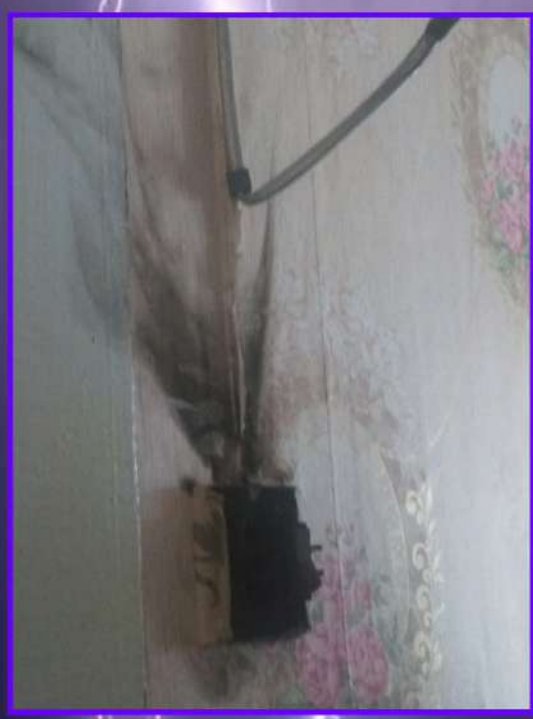
Фото последствий удара молнии в Кондинском районе в 2020 году